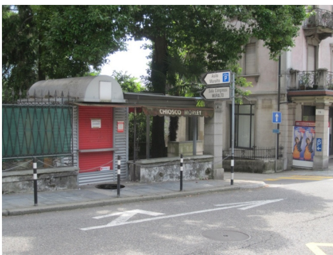
Fotomontaggio della situazione finale